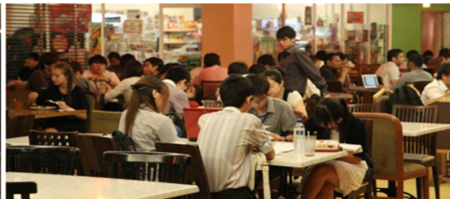
Ảnh: Khu học xá trường APU.