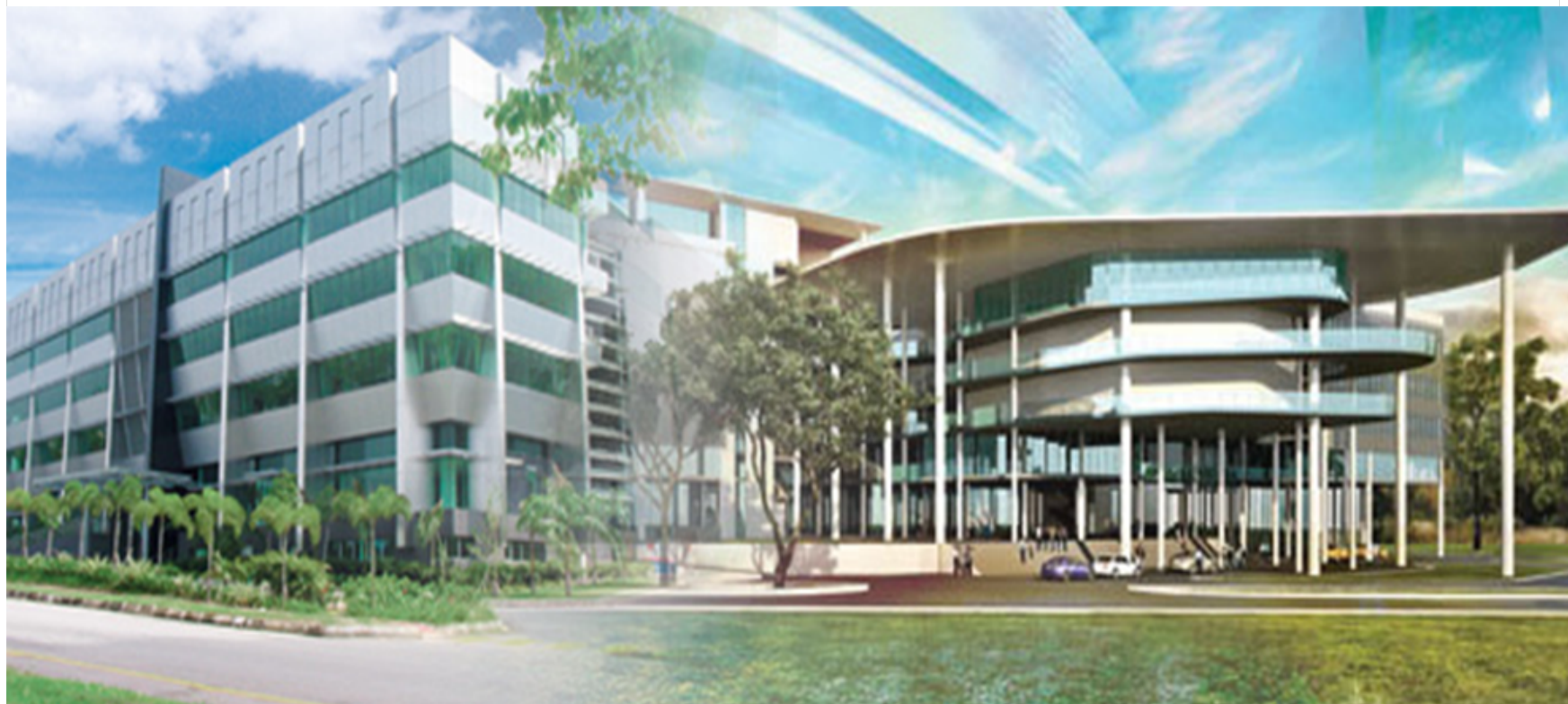
Ảnh: Khuôn viên trường Đại Học APU.