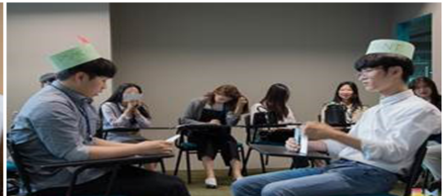
Ảnh: Buổi workshop của sinh viên tại trường APU.